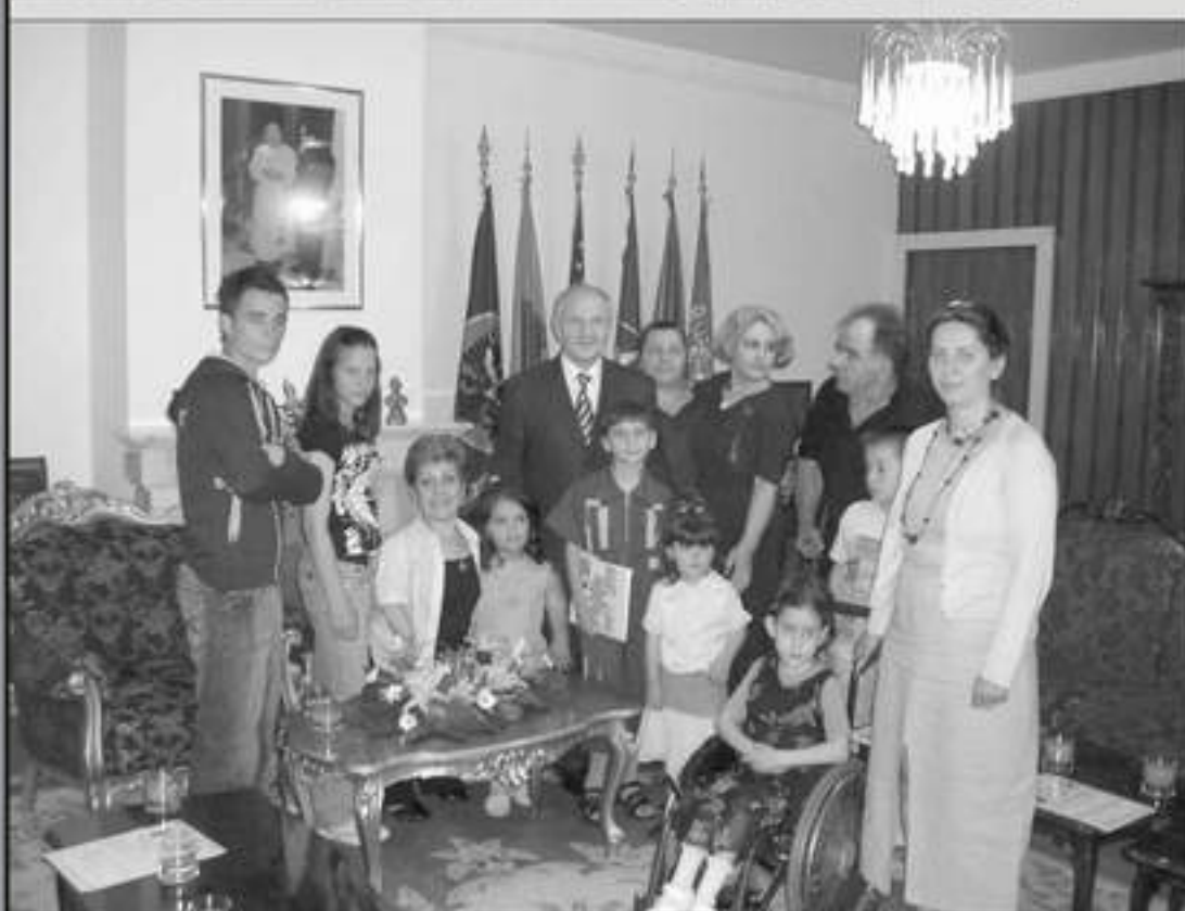
Kjo ngjarje është pjesë e Programit Promotiv vullnetar - DMD.

Cilat ishin porositë e fëmijëve në letrat kredenciale që ja dorzuan presidentit: mbrojtja e të drejtave të fëmijëve në arsim, zhvillimi i kapaciteteve të tyre, respektimi i interesit të fëmijëve, mbrojtja shëndetësore, e drejta në integritet, barazi në mes të djemve dhe vajzave, jodiskriminimi i fëmijëve me aftësi të kufizuara.